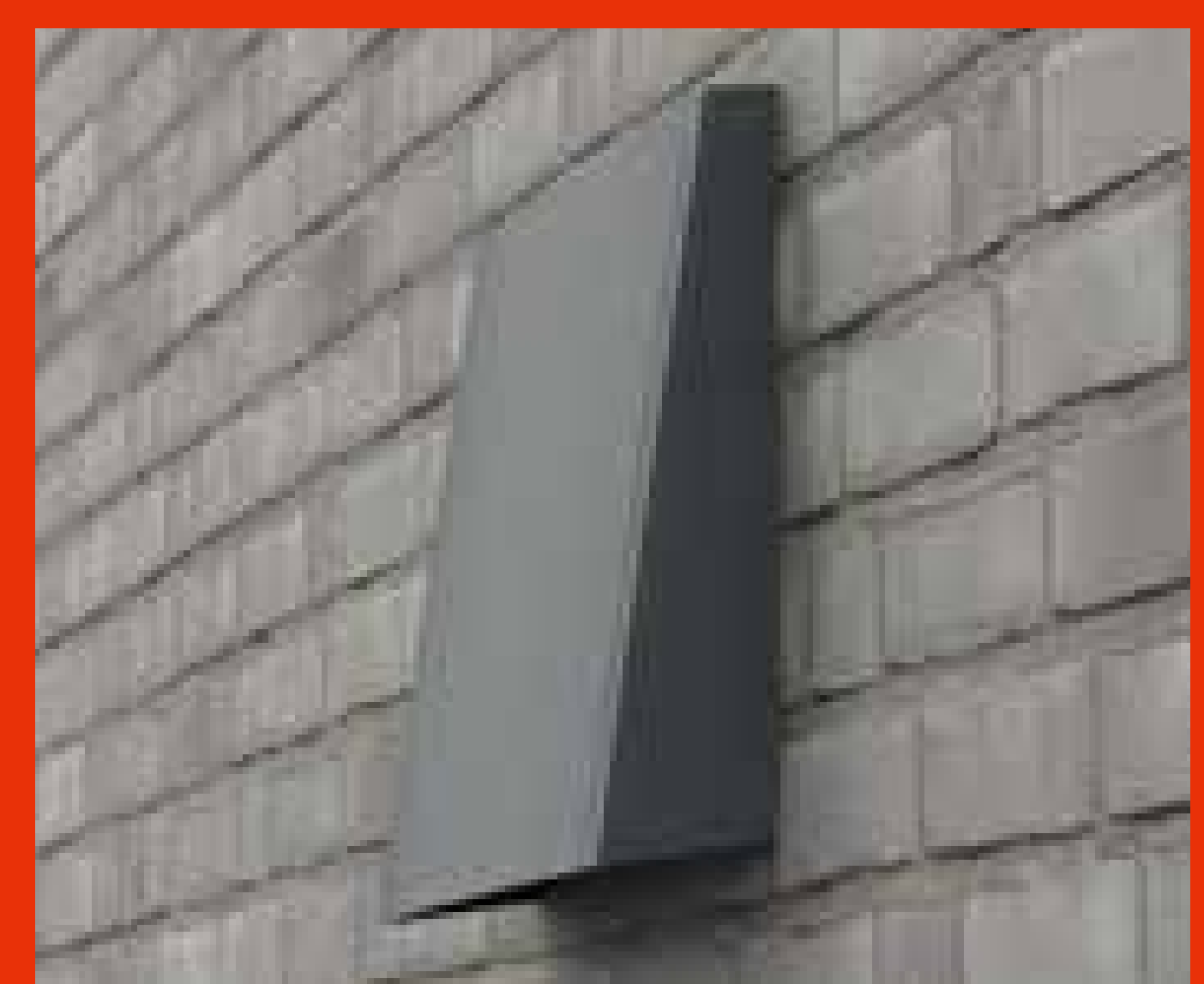
Außenwandblende in Anthrazit

Weitere Informationen finden Sie direkt hier durch Scannen des QR-Codes oder unter viessmann.de